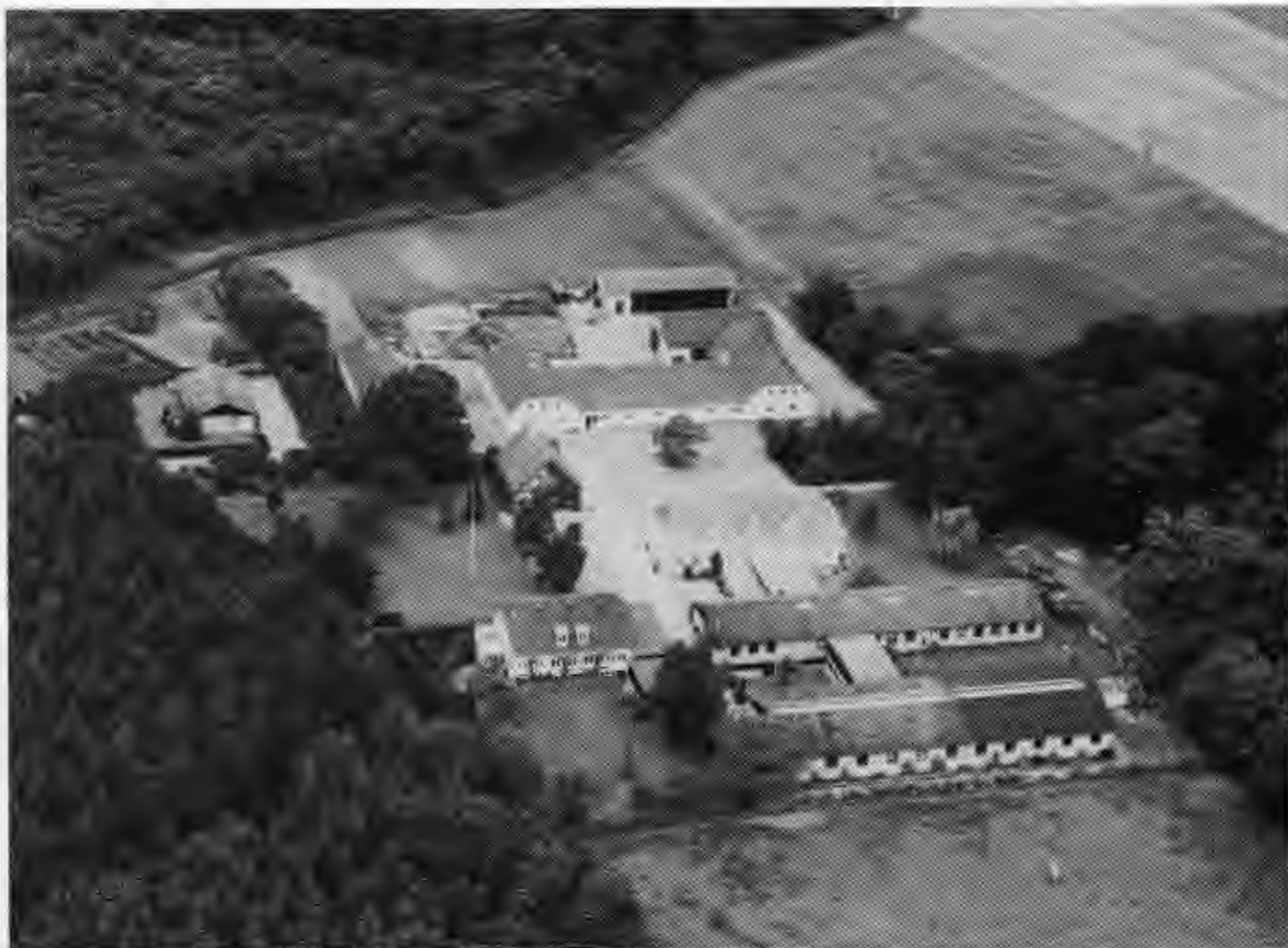
Sønderkovhjemmet set fra luften.

været med i Nykøbing F. Rotary-klub siden 1970.