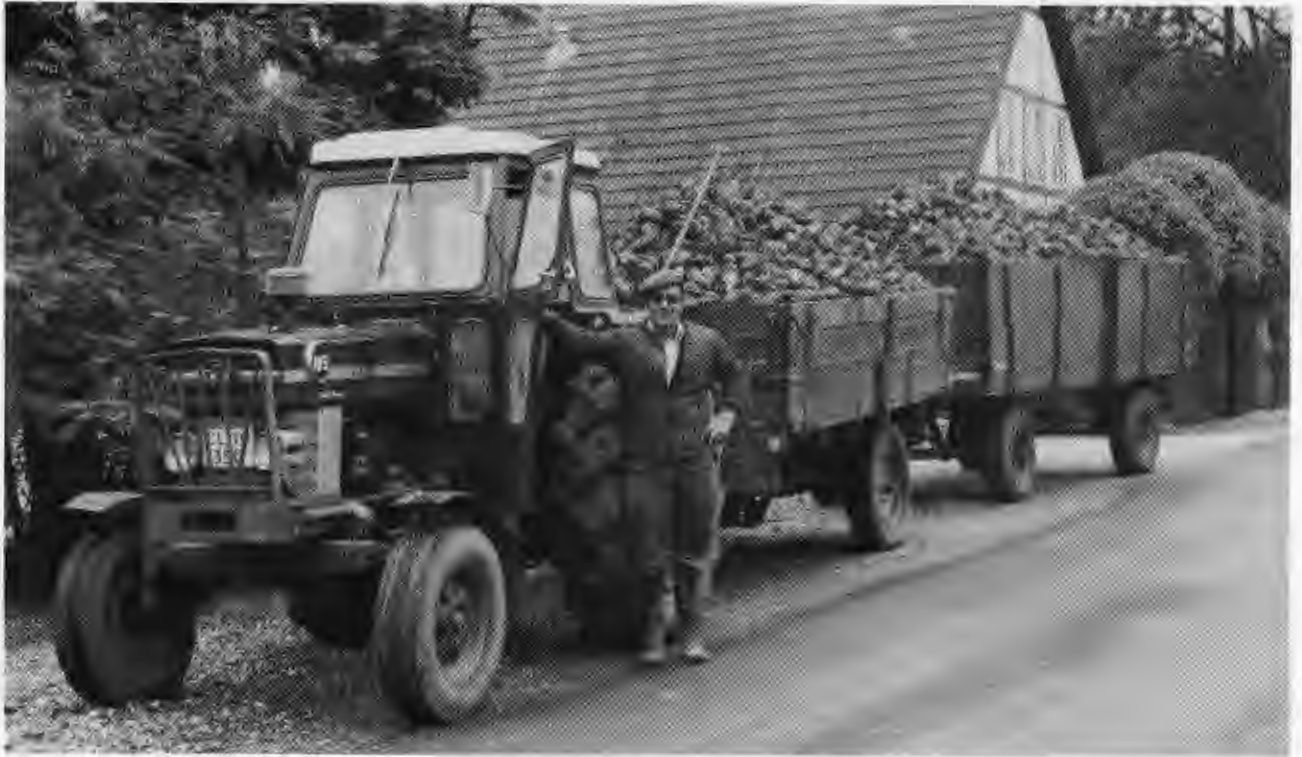
»Det hvide guld« fra Sønderskovhjemmets landbrug skal til sukkerfabrikken.

store interesse – det har ligget i blodet fra min barndom, hvor mine forældre viste os børn »vejen«. Det voksede helt naturligt gennem søndagsskole, FDF og KFUM. Så kom menighedsrådsarbejdet, kirkesangerjobbet og det mellemkirkelige arbejde. I 1989 skulle der dannes mellemkirkelige stiftsudvalg, bestående af fire læge medlemmer, to præster og biskoppen. Jeg har nu været med i dette arbejde i 3 år.