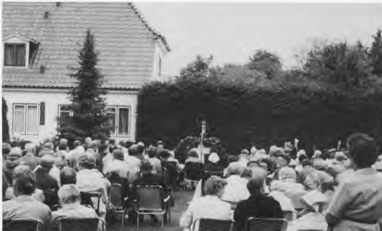
Sønderskovhjemmet har tradition for en sommerfest.

tution med en bestyrelse. I vedtægterne står der, at det arbejder i tilknytning til Kirkelig Forening for den indre mission i Danmark. Hjemmet er selvfinansierende og har ikke behov for statsstøtte. Indtægterne fremkommer ved landbrug, frivillige bidrag og beboernes delvise betaling.