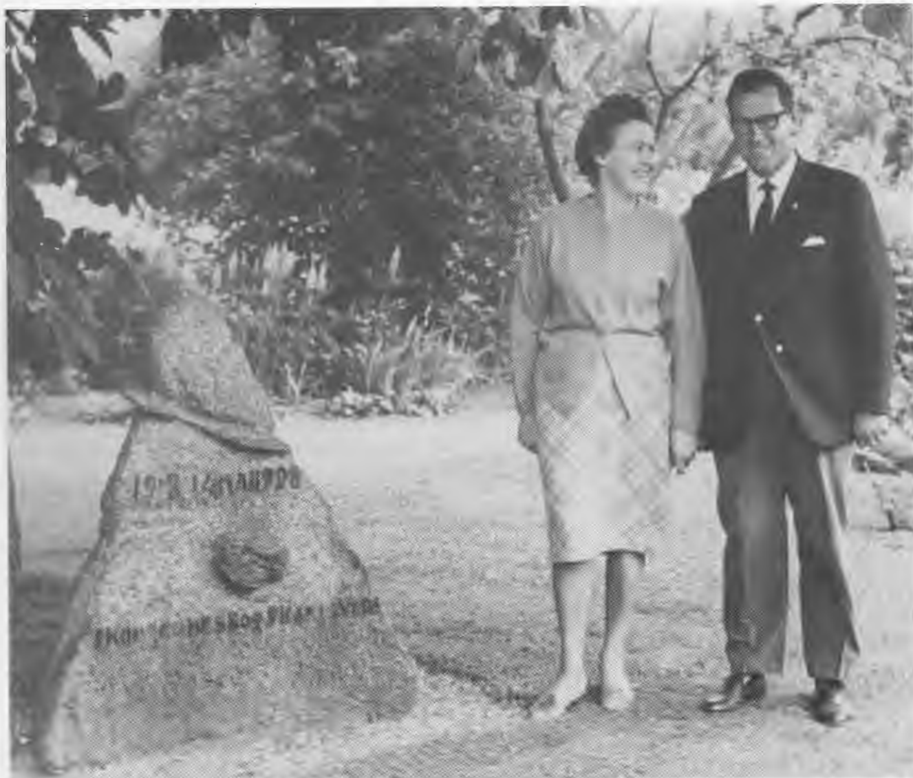
Forstanderparret ved mindestenen på Sønderskovhjemmet.