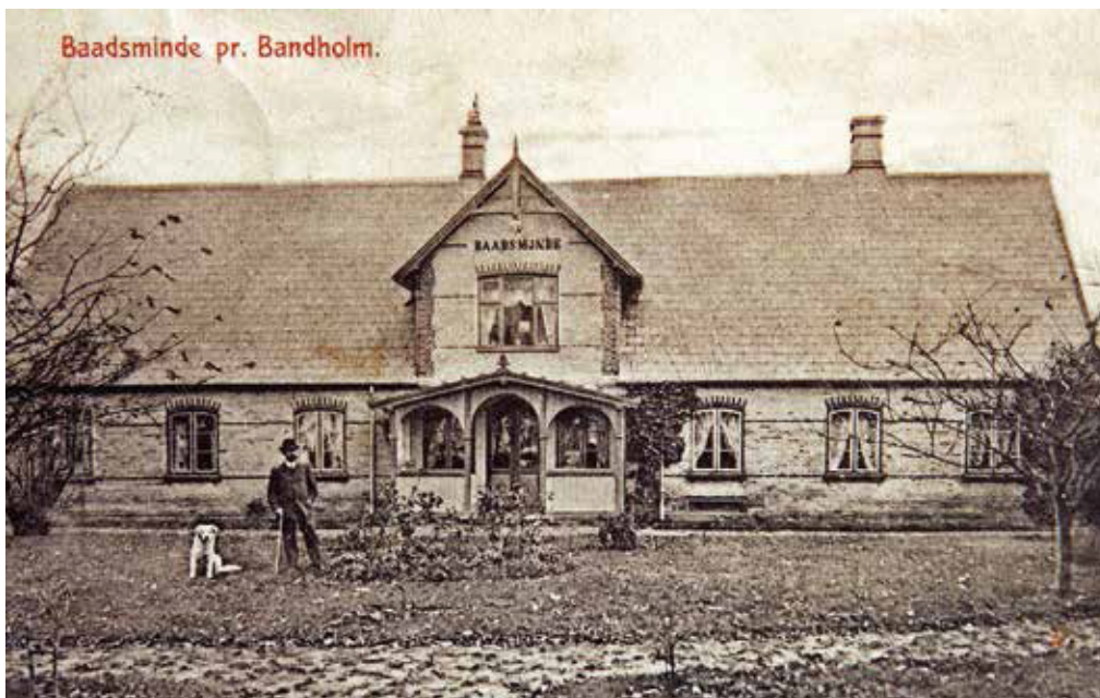
Gården Baadsminde i Reersnæs. Stuehuset ligger der stadig, men der er ikke længere navn på det, selv om navnet endnu bruges og indgår i firmaet Scandræns mail-adresse.