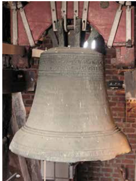
Klokken fra 1596 i Østofte Kirke med sognepræstens og kirkeværgernes navne støbt på randen.

Store dele af landbefolkningen var imidlertid ikke henvist til at nøjes med fornavn + patronym. Overalt i landet brugte man også tilnavne, der blev ført videre fra slægtled til slægtled, eller som blev knyttet til en gård, således at en ny fæster antog den forriges tilnavn. Der var dog normalt