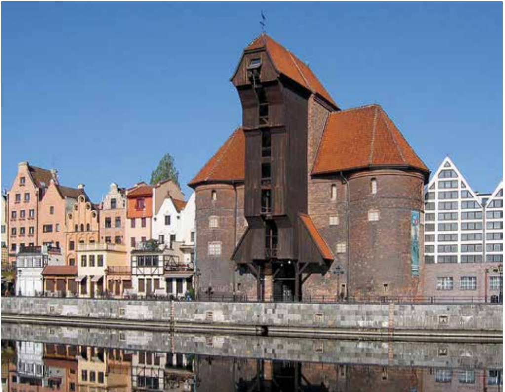
Krantor i Danzig, der både fungerede som byport og kran ved ind- og udskibningen af varer. Danzig havde fra 1300-tallets slutning udviklet sig til en af de væsentligste baltiske havne med hensyn til kornudførsel. Krantor blev opført i 1440'erne. Den blev slemt beskadiget under 2. Verdenskrig, men genopbygget i 1950'erne.

af 208½ mark 36 , og en person fra Stubbe-købing var blevet frataget 1200 mark. Der fremførtes desuden klager på vegne af Nakskov og Nykøbing samt en person fra Ger-ringe på Sydlolland.