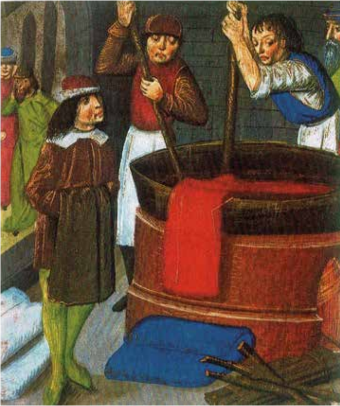
Billedet, der viser to personer, som er i gang med at farve klæde, stammer fra Flandern, der grænsede op til området omkring Leiden i Nederlandene. Ved farvningen anvendes forskellige planter som eksempelvis vajd og kermes.

klæde sammesteds fra og en sort hætte af klæde fra Leiden.