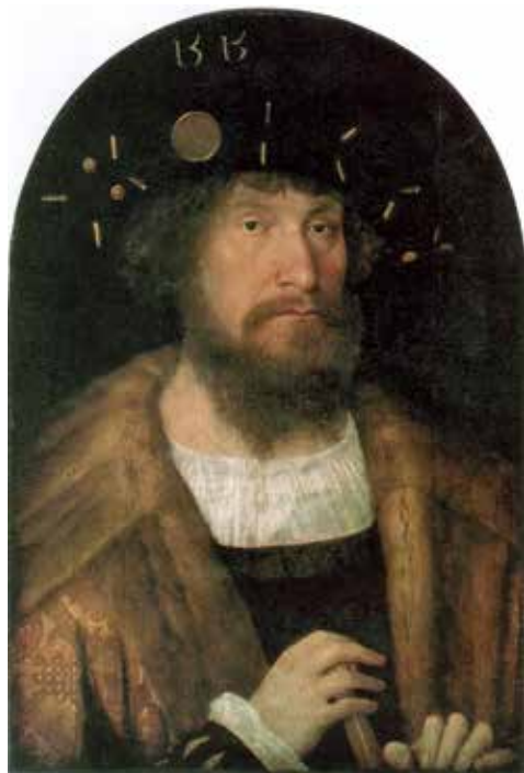
Christian II, der regerede 1513-23, forsøgte gennem sin "borgervelige" politik at fremme købstædernes handelsmæssige udvikling, men da hans regeringsperiode blev kort, fik hans initiativer ringe betydning. Portrættet er udført af Michael Sittow i 1515.

Årtiet op til valget af Christian II som konge i 1513 var præget af interne oprør