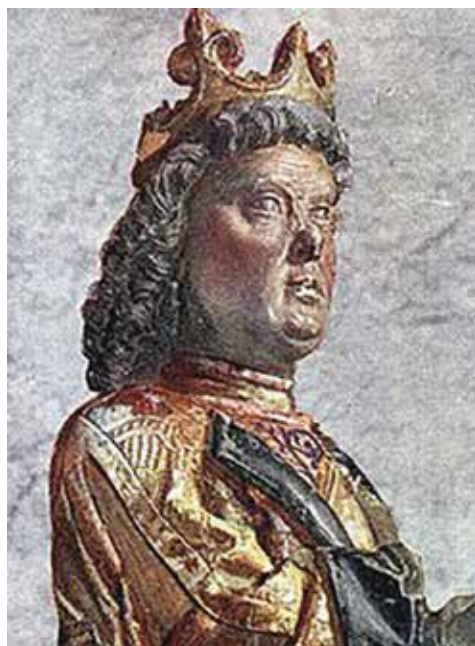
Karl Knutsson levede fra omkring 1408/09 til 1470 og var konge i Sverige i perioderne 1448-1457, 1464-1465 og 1467-1470. De vekslende perioder som konge af Sverige skal ses i relation til den danske kongemagts manglende greb om magten i Sverige. Træskulpturen er udført omkring 1480 af maleren og billedskæreren Bernt Notke (ca. 1440 - ca. 1509). Notke er desuden kendt for altertavlen i Aarhus Domkirke.