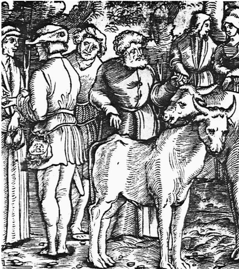
Oksehandels-scene fra Tyskland omkring 1500. Okserne fra bl.a. Danmark nåede efter en længere vandring frem til enten de tyske eller nederlandske markeder, hvor de solgtes til forbrugerne og dermed indgik i kødforsyningen til byerne.

med korn i de nærmeste dage efter forbuddets ophævelse anløb byen, og dét på trods af at frosten allerede havde sat ind. 68